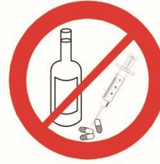
Napoje alkoholowe, narkotyki