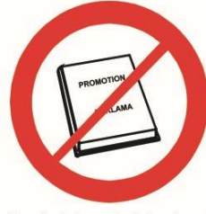
Przedmioty, materiały, ubrania komercyjne i promocyjne