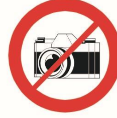
Profesjonalne aparaty fotograficzne, kamery wideo