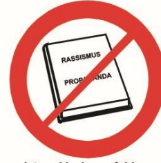
Materiały rasistowskie, ksenofobiczne, polityczne, religijne, propagandowe