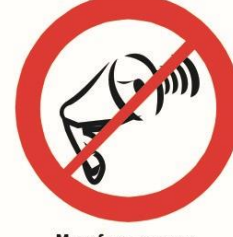
Megafony, syreny. Inne urządzenia emitujące dźwięk