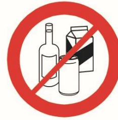
Butelki, puszki, kubki, dzbanki