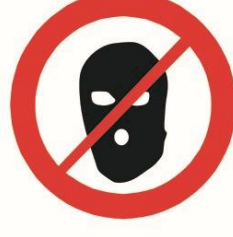
Części ubioru zakrywające twarz, kominiarki