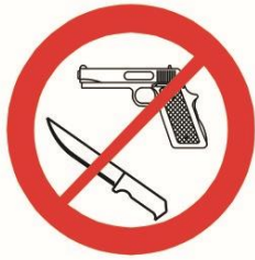
Broń, materiały wybuchowe, noże