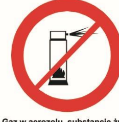
Gaz w aerozolu, substancje żrące, łatwopalne, barwniki