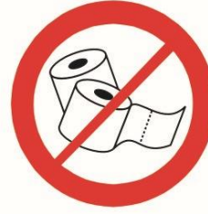
Duże ilości papieru