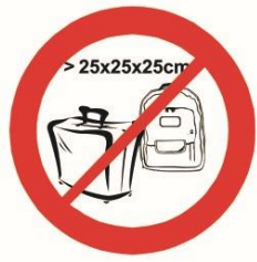
Pudła, torby, plecaki, walizki i inne wszelkie przedmioty większe niż 25 cm x 25 cm x 25 cm