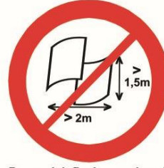
Banery lub flagi o wymiarach większych niż 2,0 m x 1,5 m.